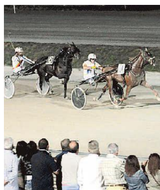
Una corsa ai Pini

Nel premio Scuderia Rossetti e Biselli alle 18,30 saranno in sei in arrivo un po' da tutto il centro Italia, tutti chiaramente debuttanti