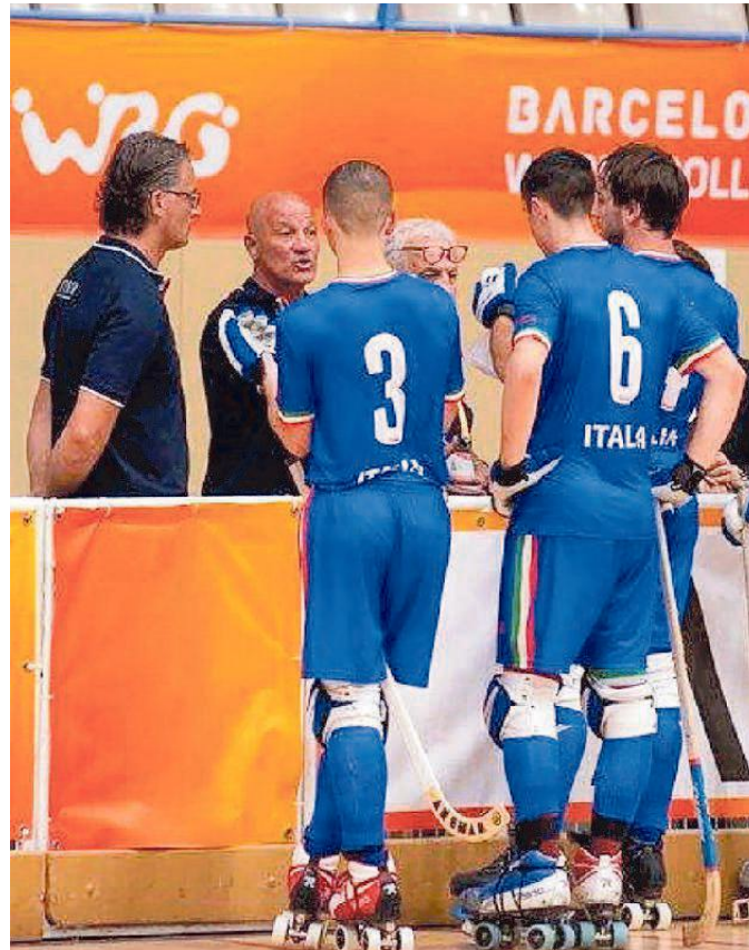
Un timeout della formazione Under 19